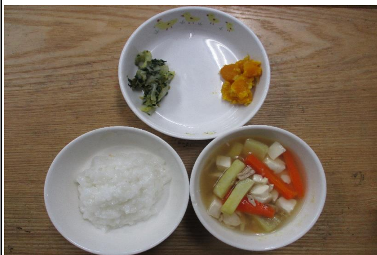
【離乳食】肉豆腐・夏野菜の焼き浸し・みそ和え