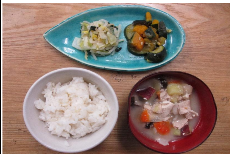
【普通食:以上児】肉豆腐・夏野菜の焼き浸し・酢みそ和え

ズッキーニは見た目はキュウリのようなのですが、カボチャの仲間です。カボチャとの違いは、完熟してからではなく、開花後5～7日の未熟果を食べることです。ほのかな甘みがあり淡白な味わいで、皮も柔らかいため、皮ごと食べられます。