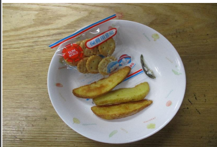
【おやつ:以上児】フライドポテト・炒りじゃこ・お菓子